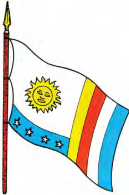
Bandera de Gual y España -1797-