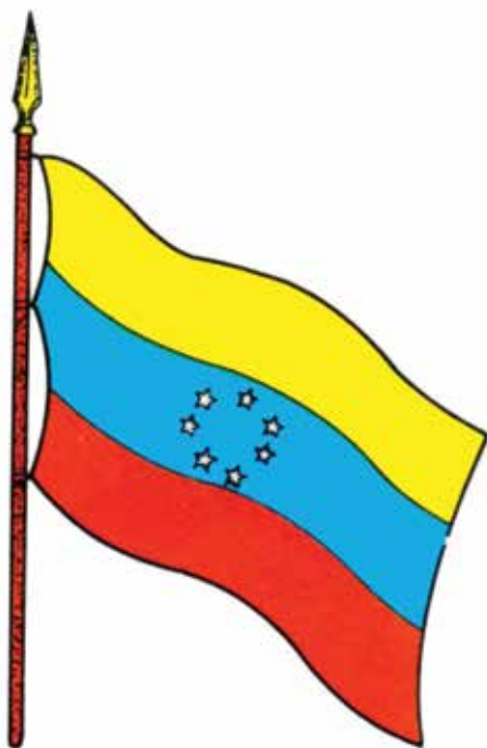
Bandera decretada por el General Cipriano Castro -28 de marzo de 1905-