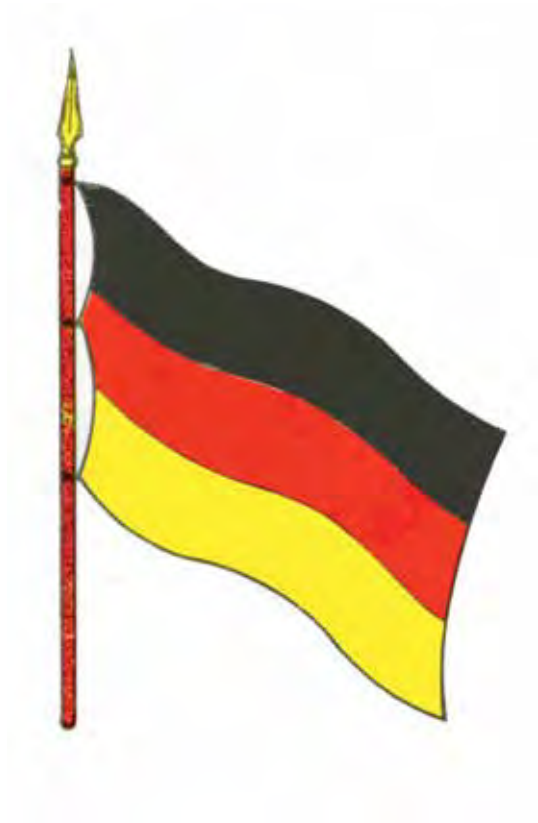
Bandera de Miranda Proyecto del Ejército Colombiano -1800-