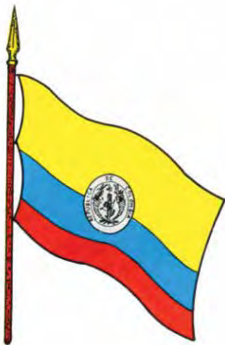
Bandera de la República de Colombia