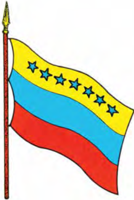
Bandera de la Federación –Coro, febrero 1859–