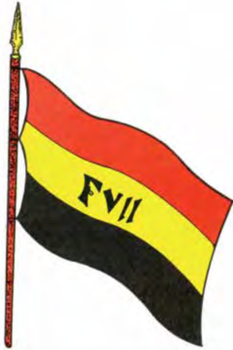
Cucarda de los Revolucionarios -4 de mayo de 1810-