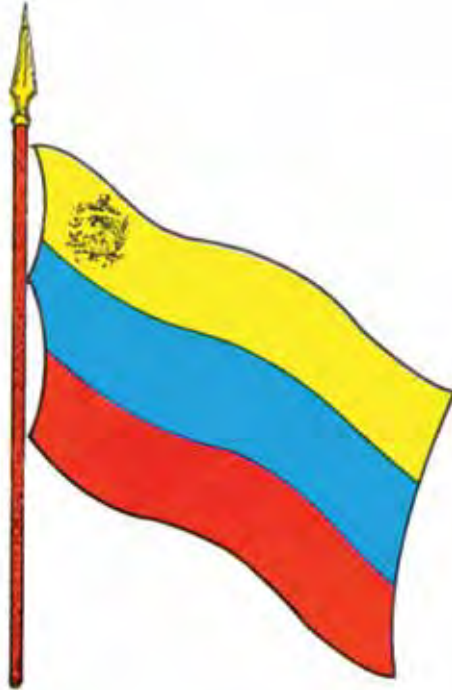
Bandera de Franjas Iguales -Año 1836-