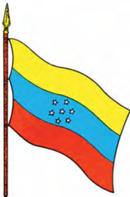
Bandera decretada por el General Juan Crisóstomo Falcón –29 de julio de 1863–