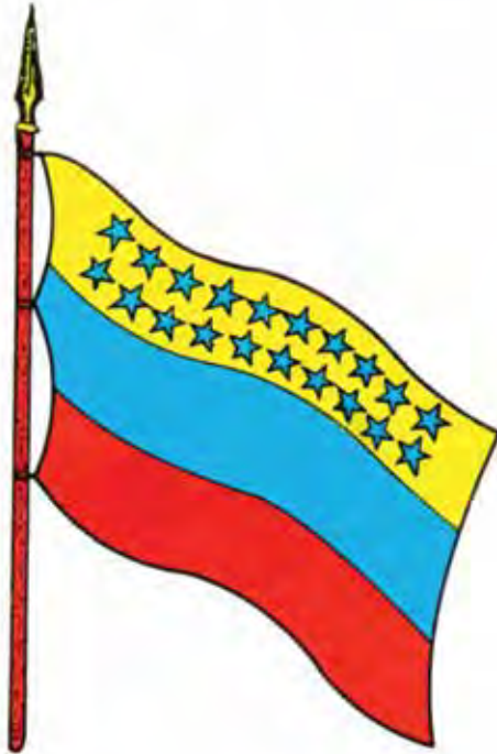
Bandera de la Federación -Barinas, Junio 1859-