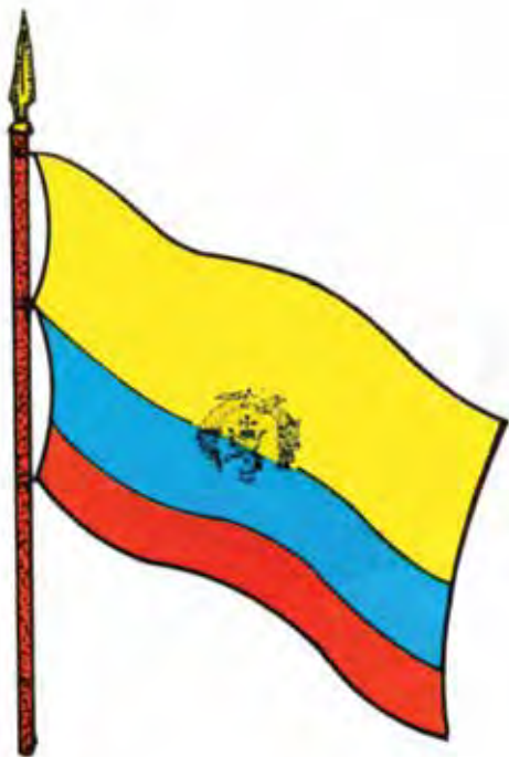
Bandera de la República de Venezuela -Año 1830-