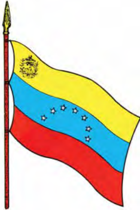
Bandera nacional actual -15 de julio de 1930-