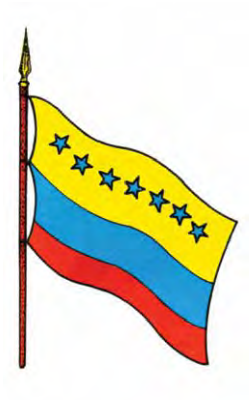
Bandera del Gobierno Federal -Pampatar, 12 de mayo de 1817-