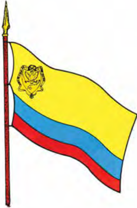
Bandera de la Gran Colombia -4 de octubre de 1821-